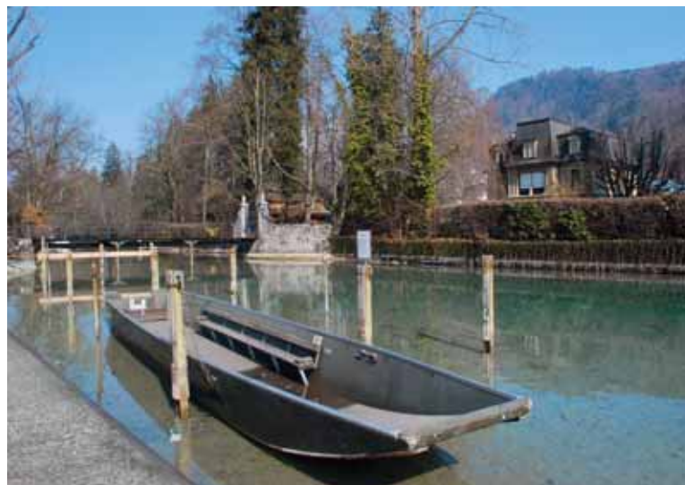
Auch das gehört zum Aarefeld-Quartier: Idylle beim Kleinstinseli