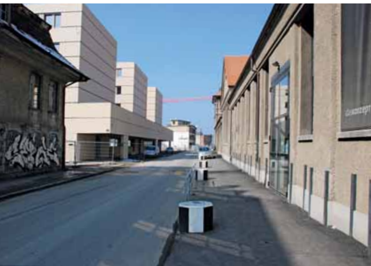
Erst im Entstehen ist das rasch wachsende Selve-Quartier mit den neuen Verwaltungsgebäuden des Kantons (links) und der Event-Halle 6 (rechts).