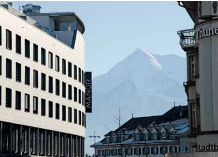
Kontraste: Moderne Thuner Architektur, Niesen und Bahnhof

Mit rund 550 Einwohner/-innen ist das Aarefeld ein ganz kleines Thuner Quartier mit enormer Ausdehnung entlang der Bahngeleise. Kennzeichen sind der Bahnhofplatz, der Aarefeldplatz, die Schiffländte, das Kleistinseli, das «Selve»- sowie das «Emmi»-Areal.