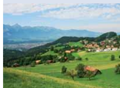
Ausblick nach Thun hinunter und zur Stockhornkette.

Das ehemalige Hotel Jungfrau ist eines der Wahrzeichen Goldiwils.