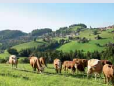
...ein Dorf: Goldiwil ob Thun.