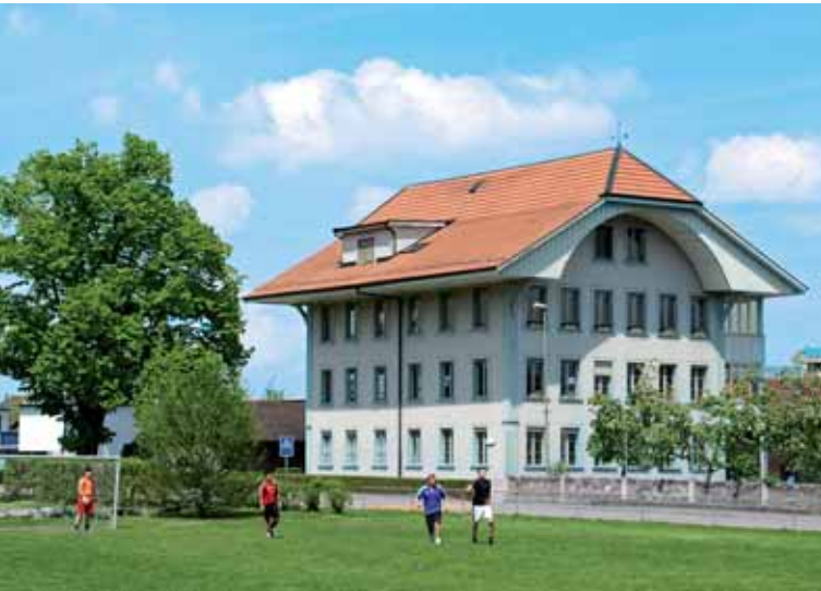
Schulhaus Schoren: eines der Wahrzeichen im «Schorendörfli».

Mit über 3300 Einwohnerinnen und Einwohnern ist das Quartier Gwatt-Schoren-Buchholz ein mittelgrosser Thuner Stadtteil, etwa von der Grösse der Gemeinde Saanen. Bekannte Kennzeichen sind unter anderem der Bonstettenpark, die Burg Strättligen und der Burgerwald.