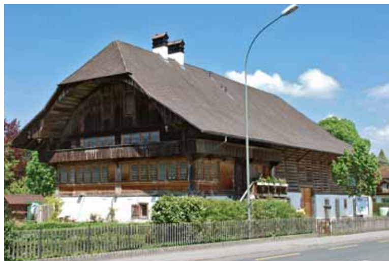
Das stattliche Bauernhaus des Gutsbetriebes Bonstetten.

Interview: Urs Niklaus