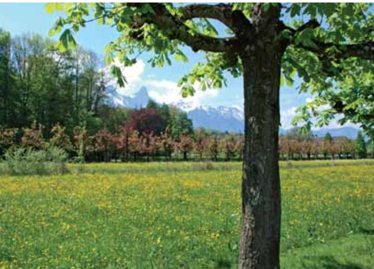
Frühling auf den Wiesen und in den Alleen des Bonstettenparkes.