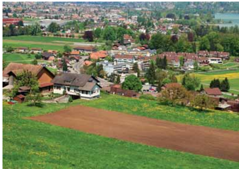
Sicht vom Burgunderweg auf das Wohngebiet in Gwatt.

bekannt. Streunende Hunde kommen ganz selten vor. Mehr Konfliktpotenzial steckt im Bonstettenpark und Gwattlischenmoos, wo die Vorschriften allzu oft missachtet werden. Insbesondere auf den landwirtschaftlich genutzten Flächen stehen die Bewirtschafter im Sommer immer wieder vor grossen Problemen.