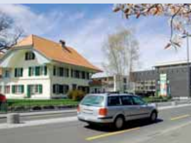
... und dem alten restaurierten «Stöckli».