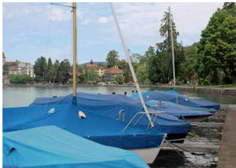
Bootsplätze an der Bächimattpromenade. Hinten v.l.n.r. Thunerhof, Berntorschule und Restaurant Dampfschiff.