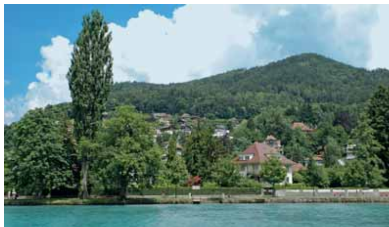
Exklusive Hangwohnlage im Riedquartier und an der Bächimattpromenade.

Interview: Urs Niklaus