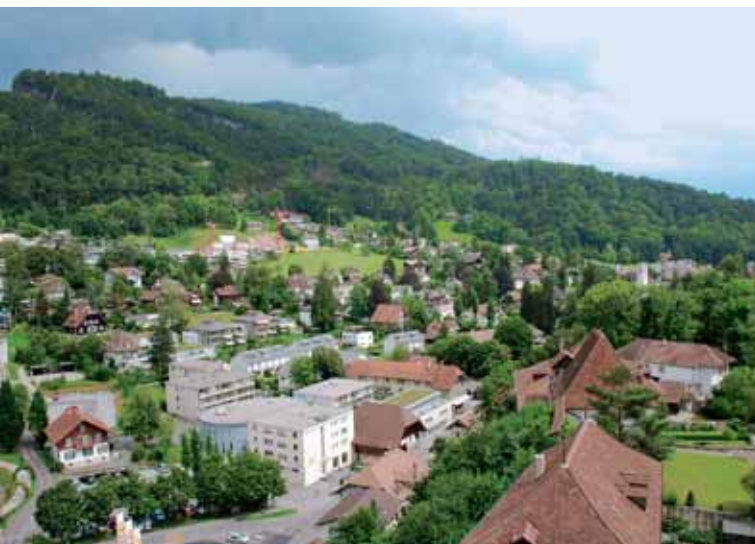
Blick vom Schloss auf die Baustelle Höhweg und die noch nicht ganz überbaute Blüemlimatt.

Eine wichtige Strasse, die Hofstettenstrasse. Schleichwege haben wir mit Ausnahme der Wartstrasse nicht – und wer die Möglichkeiten der Wartstrasse nicht kennt, kann sie auch nicht nutzen.