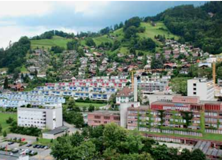
Terrassensiedlung am Brändlisberg und Wohnhäuser in der Lauenen, blau- und rotfarbige Reihenhäuser Hübelimatt hinter dem Spital Thun.

Mit über 3550 Einwohnern ist das Quartier Lauenen-Hofstetten-Ried ein mittelgrosser Thuner Stadtteil. Bekannte Kennzeichen sind unter anderem der Aarequai und der Brahmsquai, die Obere Wart, der Brändlisberg, der Grüsisberg, die Rabenfluh und das Jakobshübeli.