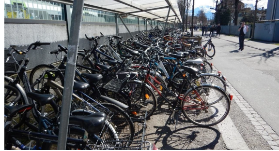
Abbildung 3: Ist-Situation Bereich Ost