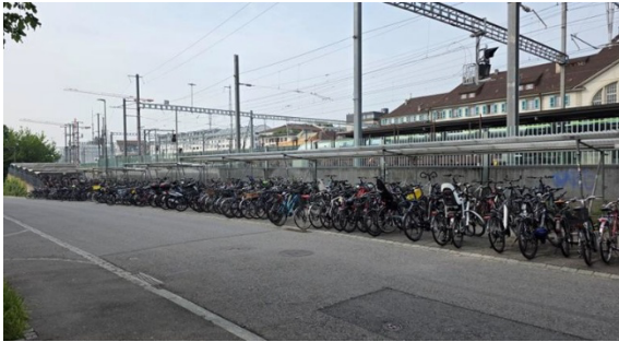
Abbildung 2: Ist-Situation Bereich West