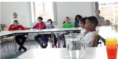
„multipuls läuft“ - Ernährungs-Workshop