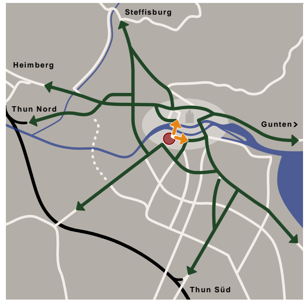
Im Wechsel mit Lichtsignalanlage