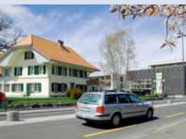
... und dem alten restaurierten «Stöckli».