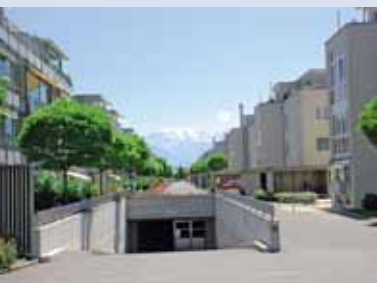
Wohnstrasse im Hohmadpark.

Dazu sind die Voraussetzungen nicht ideal. Gebiete mit Einfamilienhäusern und solche mit