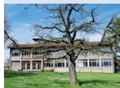
Das Hohmadschulhaus mit seinem charakteristischen Türmchen.

Die Hohmadpark-Überbauung gibt dem Quartier entlang der Frutigenstrasse ein neues Gesicht.