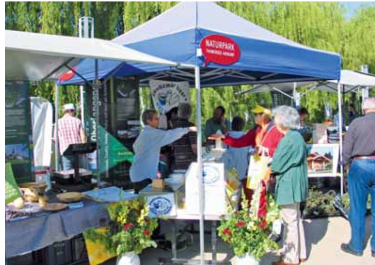
An den Marktständen wird auch Informationsmaterial über den Naturpark abgegeben.

Die Marktauftritte, kombiniert mit Öffentlichkeitsarbeit, sind für den Naturpark eine wichtige Kommunikationsmassnahme. Denn bereits im kommenden Winter stimmen die am Park beteiligten Gemeinden an den Gemeindeversammlungen oder an der Urne