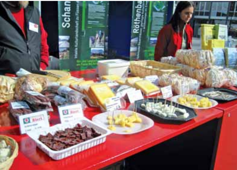
Schlaraffenland Naturpark: Köstlichkeiten aus den Parkgemeinden.

Marktauftritte sind für den Naturpark Thunersee – Hohgant eine wichtige Plattform. So können sich Parkgemeinden, Produzenten und Tourismusorganisationen ideal präsentieren. Sehr zur Freude der Kunden.