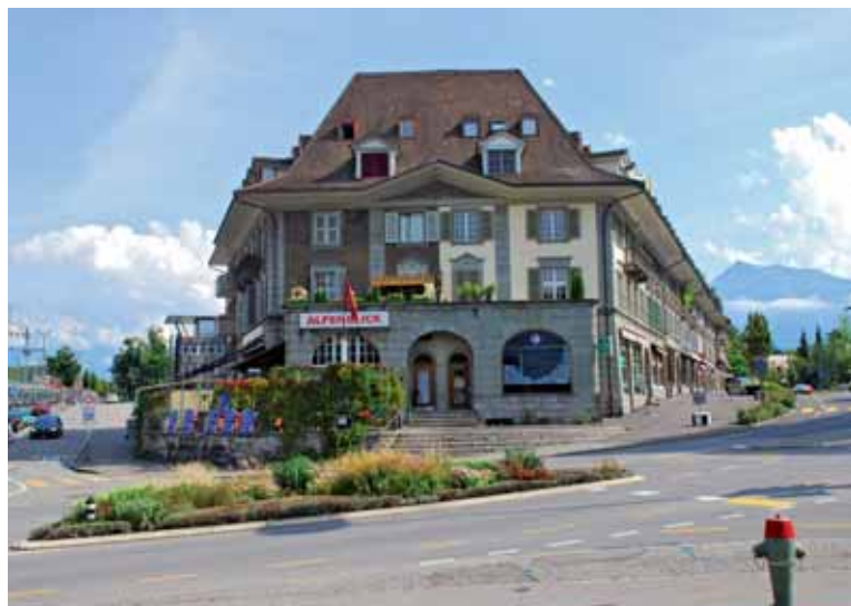
Der imposante Gebäudekomplex aus dem Jahr 1923 bildet mit der Mönchstrasse links und der Frutigenstrasse rechts die Leistgrenze.

Beispiel in diesem Jahr die Besichtigung der Messerschmiede Schoder oder einen Fondueabend, alle zwei Jahre das Sommerfest mit einem Fussballturnier, dann «let's dance» – die Oldies-Disco und in der Vorweihnachtszeit den «Samichlauseabe».