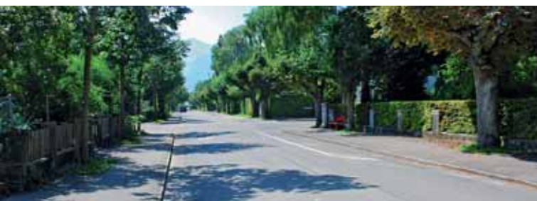
Alleebäume an der 700 Meter langen Niesenstrasse.

Nicht nur! Wir organisieren zu Ostern das «Ostereiertüsche», das «Blüemlisalpzmorge», zwei Leistanlässe pro Jahr wie zum