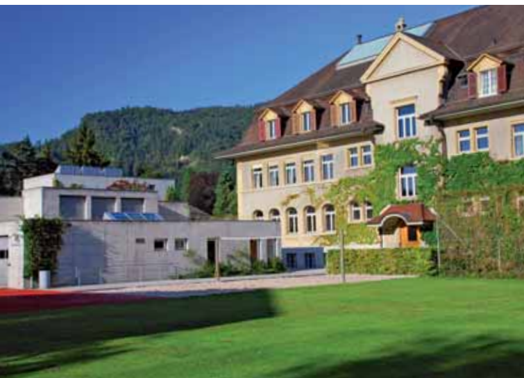
Die Gebäude aus 2 Architekturepochen ergänzen sich beim Gymnasium Seefeld.